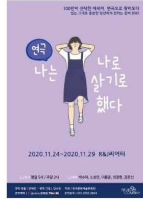
2020.11 연극 '나는 나로 살기로 했다' 기획, 제작

영화 '시라노 연애 조작단'을 모티브로 한 뮤지컬. 사랑하는 사람의 마음을 얻어내기 위한 서투른 사람들의 좌충우돌 스토리를 풀어낸 공연.