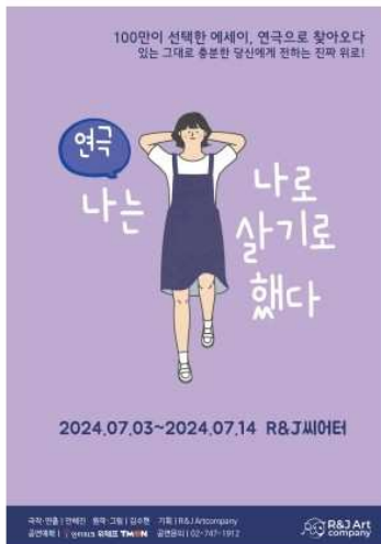
연극 '나는 나로 살기로 했다'

연극 <나는 나로 살기로> 했다는 100만부 이상 팔리며 몇년 째 에세이부문 베스트셀러로 자리잡고 있는 에세이 '나는 나로 살기로 했다'에 스토리를 더해 연극으로 만든 작품입니다.