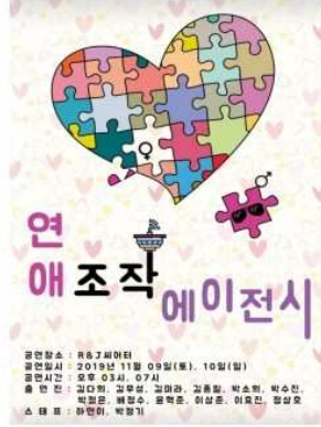
2019.11 뮤지컬 '연애조작에이전시' 기획, 제작

주변 지인들이 각자의 시선으로 바라보는 '용팔이'에 대해 그린 연극. 관계 속에 살아가는 우리 자신의 모습을 되돌아 볼 수 있는 공연.