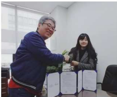
마포 청소년 수련관 업무협약