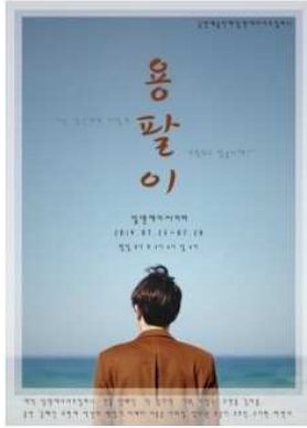
2019.08 연극 '용팔이' 기획, 제작

주변 지인들이 각자의 시선으로 바라보는 '용팔이'에 대해 그린 연극. 관계 속에 살아가는 우리 자신의 모습을 되돌아 볼 수 있는 공연.