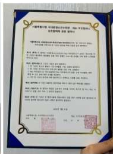
서대문 청소년 수련관 업무협약