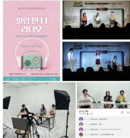
온라인 공연은 유튜브 라이브로 진행됩니다